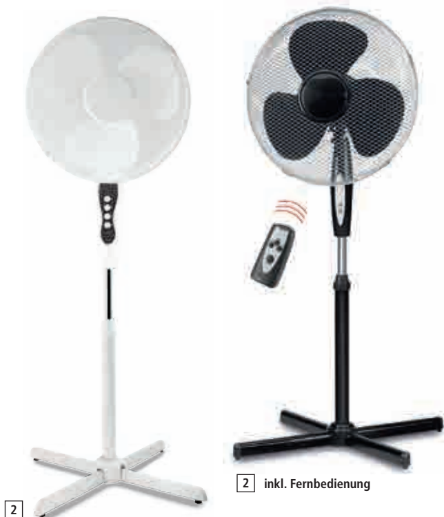
2 inkl. Fernbedienung