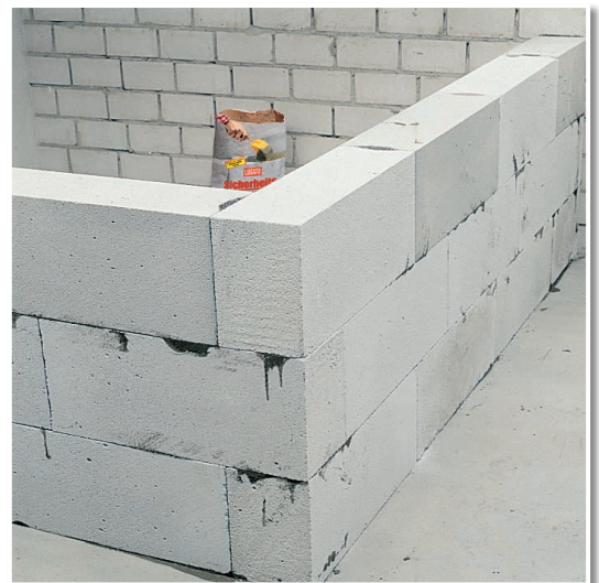
Mit SICHERHEITSKLEBER PORENBETON geklebte Wände.