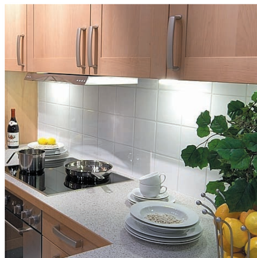
Fliesenkleben sauber und perfekt in einer Küchezeile.