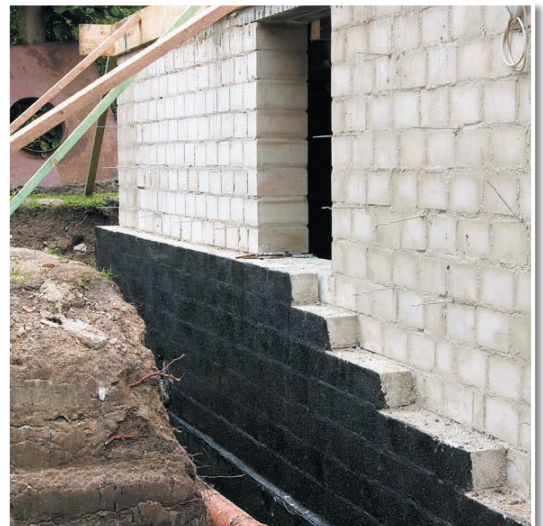
Nahtlose und flexible Abdichtung einer Kelleraußenwand mit SCHWARZER BLOCKER SCHUTZFOLIE.