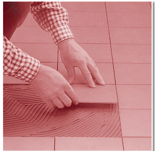
Fliesenkleben auf einem Heizstrich.